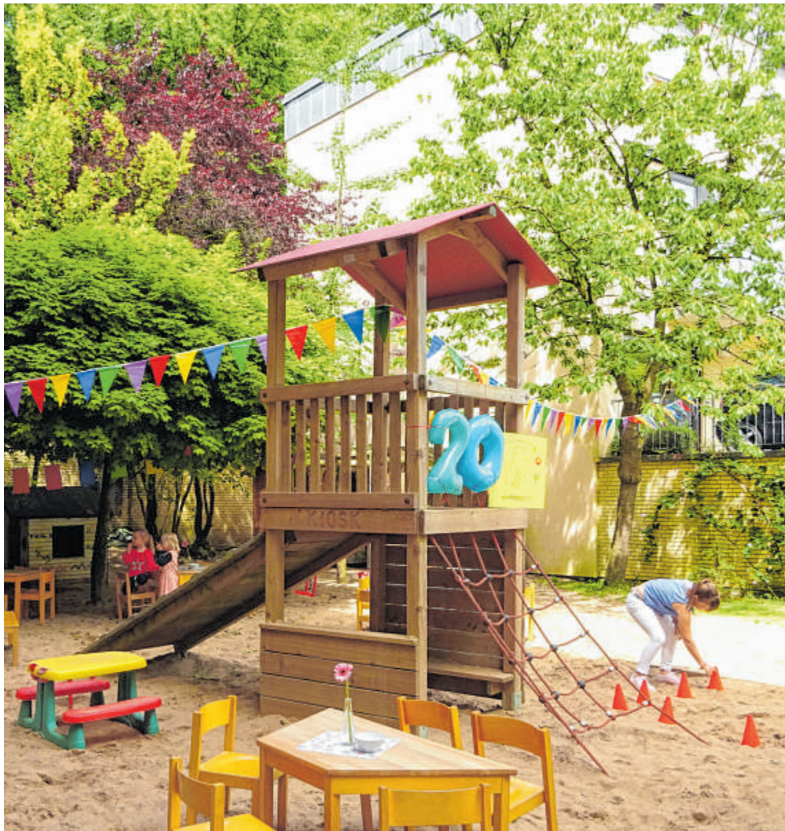
Seit 20 Jahren hat die Kita Wunderwelt ihr Zuhause auf dem Gelände der Ruhrlandklinik. Bald muss sie umziehen.

Eine andere Perspektive am bisherigen Standort – das haben beide Seiten geprüft, „aber es findet sich nichts Geeignetes“, zeigt sich