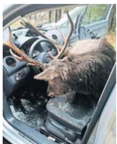
Das Geweih des Hirschen war im Lenkrad eingeklinkt.

KÖSSEN (dpa) Ein Hirsch ist einem Mann in Tirol plötzlich vor das Auto gesprungen, durchschlug die Windschutzscheibe und landete auf dem Fahrersitz. Der Vater und sein Sohn aus Bayern waren mit ihrem Wagen auf dem Weg zu einer Skipiste, als gestern das Unglück bei Kössen nahe der deutsch-österreichischen Grenze passierte. „Es gibt auf der Strecke viele Wildunfälle, aber so etwas haben wir noch nie gesehen“, sagte ein Polizeisprecher. Das Tier verendete im Wageninneren. Der 47 Jahre alte Fahrer und sein 15-jähriger Sohn wurden verletzt. Ein Hubschrauber flog den Vater ins Krankenhaus, der Schüler wurde in ein Tiroler Spital gefahren.